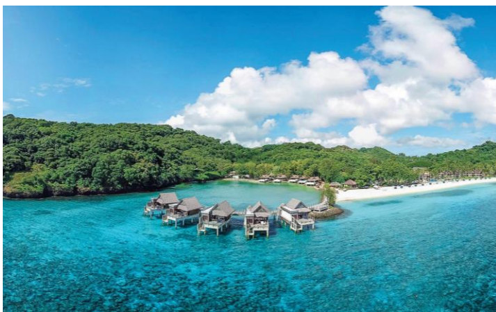
パラオ パシフィック リゾート全景

海洋生物豊富な西太平洋と、パラオの固有種や絶滅危惧種等の鳥類が多く生息する森林に囲まれた、豊かな自然を同時に体験することができる希少性の高いロケーションを生かし、パラオ政府が自然環境の保護と観光業の発展を両立させるために掲げる、ハイエンド向けのエコツーリズム・デスティネーションへの変革という目標に向け、今後も更なる取り組みを強化していきます。