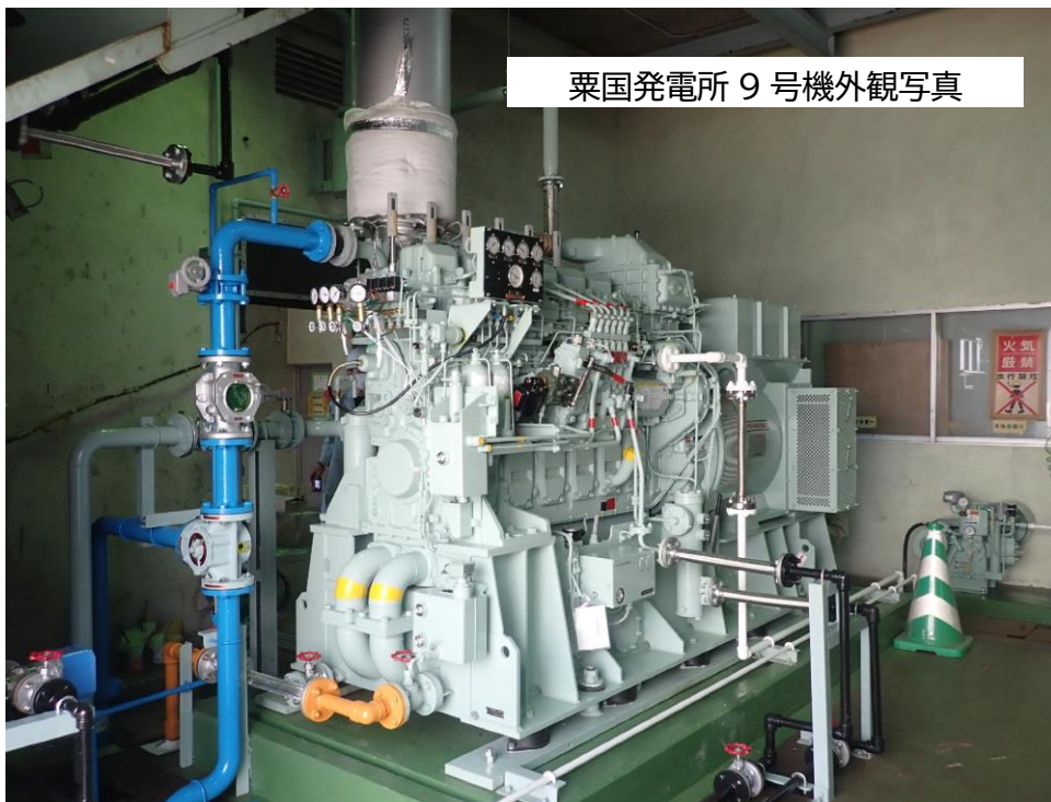
粟国発電所 9 号機外観写真