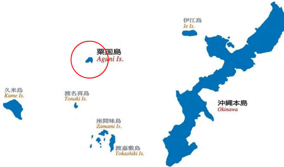
[引用:粟国村勢要覧]