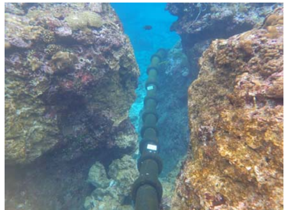
[写真 2 海底ケーブル敷設状況]