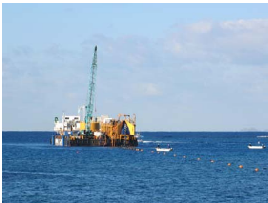
[写真 1 敷設専用台船による敷設工事の様子]