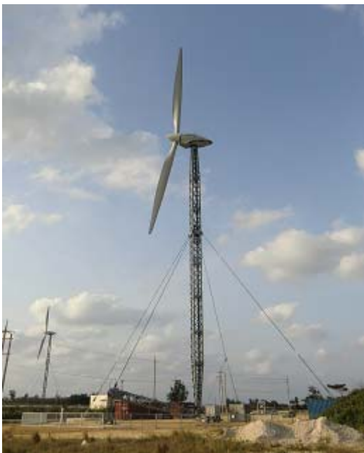
【写真 1：風車全景(2号機)】