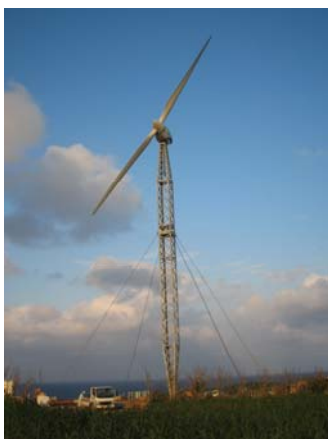
写真 2：可倒式風車全景