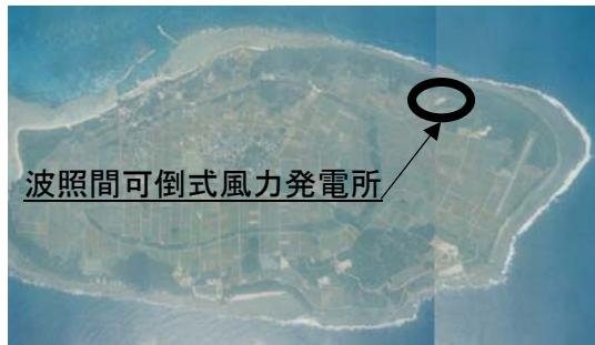
写真 1：可倒式風力発電設備設置場所