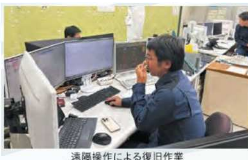
遠隔操作による復旧作業