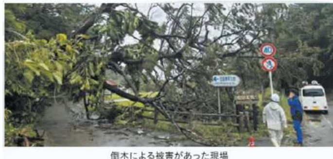
倒木による被害があった現場