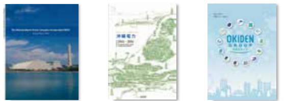
【アニュアルレポート】当社の会社概要および財務諸表(英文) 【沖縄電力】当社の会社概要について 【沖電グループ】沖電グループ各社の会社概要について