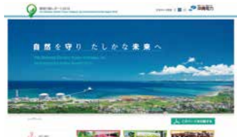
【環境行動レポート(Web版)】 当社の環境問題に対する取り組みについて