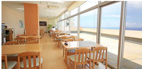
明るく開放的な職員食堂