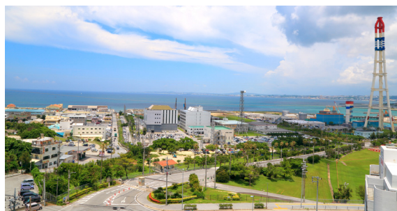
5階テラスからの眺め

「動きやすさ」というコンセプトは新しく導入された電化厨房にもいかされました。厨房職員の動線を考慮に入れたゾーニングと、電化による安全、清潔、快適な作業環境から、日々365食余りの食事が、効率よく作られています。