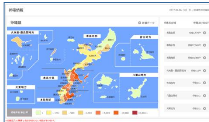
図3: 「台風や非常災害時の停電」 ※地図表示サービス