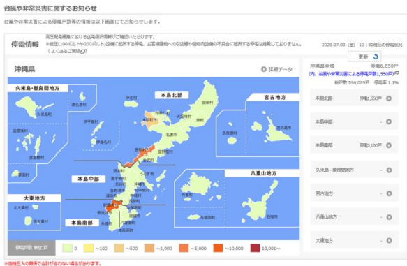
図5: 停電状況表示画面 * 地図表示