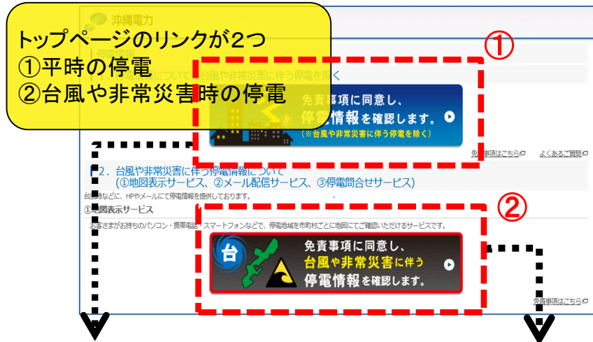
図2: 「平時の停電」※一覧表示