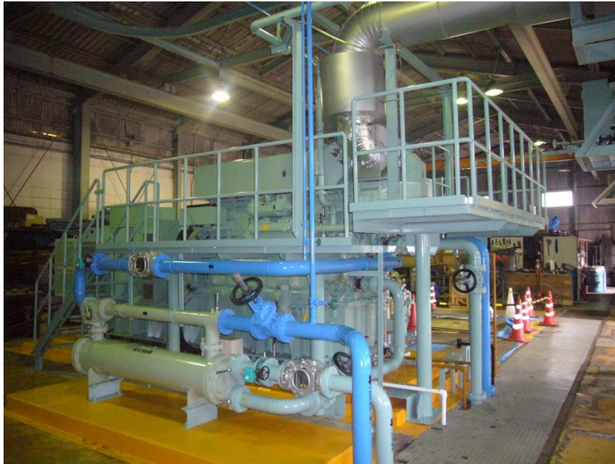
9号機発電設備 外観②