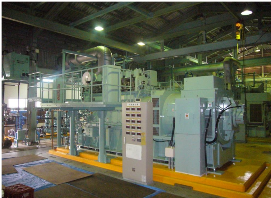
9 号機発電設備 外観①

機 関 種 類 : 立型単動水冷 4 サイクルディーゼル機関 (過給機付き) 機 関 型 式 : 6EY22ALW (メーカー: ヤンマー (株)) 発 電 機 型 式 : NTAKL-SC (メーカー: 西芝電機 (株)) 出 力 : 1,000 kW (発電端) 回 転 数 : 900rpm 燃料の種類 : A 重油