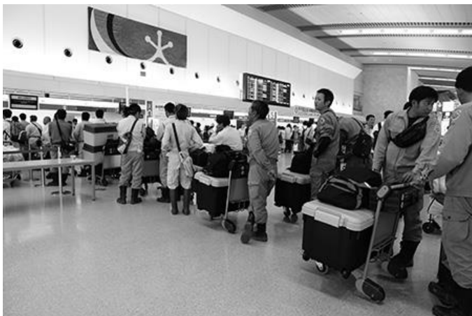
早期復旧に向けた事後派遣の作業員(那覇空港)