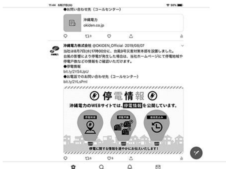
Twitter で台風 9 号の情報を発信しました

当社公式の Twitter と Facebook で、毎正時の停電情報や復旧作業の様子、注意喚起などを動画・写真・イラストを用いてユーザーへ発信しました。