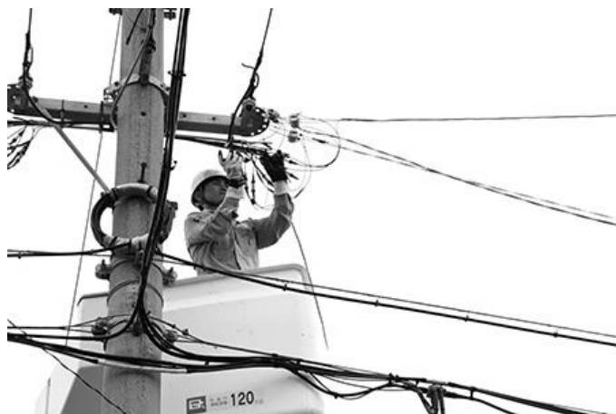
高所作業車での復旧作業