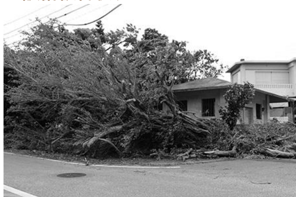
電線への樹木接触