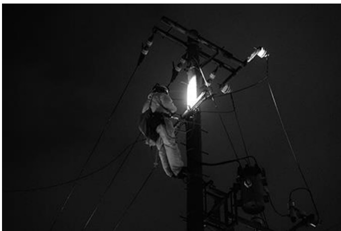
深夜に及ぶ復旧作業