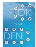
【沖電グループ】 沖電グループ各社の 会社概要について