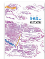
【沖縄電力】 当社の会社概要に ついて