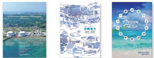
【Annualレポート】当社の会社概要および財務諸表(英文) 【沖縄電力】当社の会社概要について 【沖電グループ】沖電グループ各社の会社概要について

Webトップ ▶ 会社情報 ▶ 広報・広告ツール ▶ ▶ パンフレット・資料のご案内