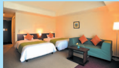
エグゼクティブツインルーム