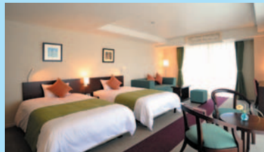
エグゼクティブオーシャンルーム