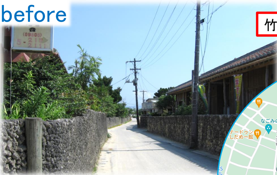
竹富島町道大柵線電線共同溝