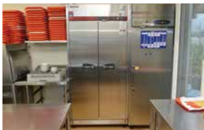
5 食器消毒保管庫 食洗機で洗った食器の消毒および保管ができるので、衛生面も安心です。