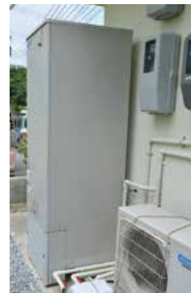
エコキュート 再生可能エネルギーである大気中の熱を利用し、少ないエネルギーでお湯を沸かします。