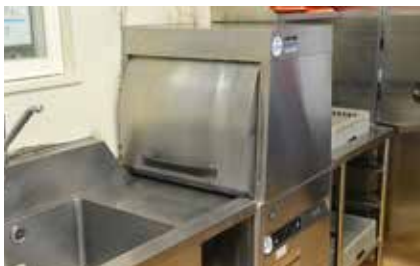
4 食器洗浄機 たくさんの食器を短時間で一度に洗浄可能。後片付けもスピーディーに行えます。