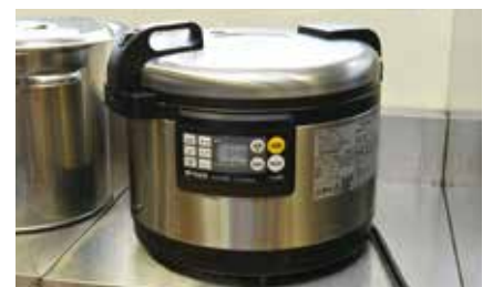
3 IH炊飯器 200V高火力IHでおいしいごはんを効率よくふっくら炊きあげます。