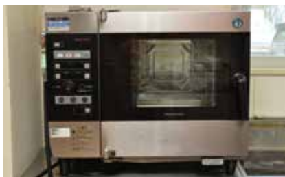
1 スチームコンベクションオーブン 焼く・蒸す・煮るが一台でこなせる多機能加熱調理機器です。