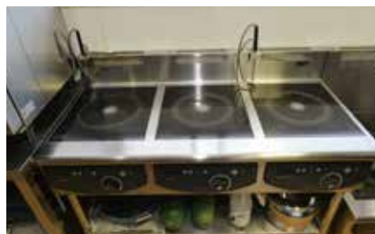
2 IH調理器 熱効率が良いので、湯沸かしや調理の加熱が早く、調理時間が大幅に短縮できます。