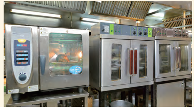
1 スチームコンベクションオーブン + 2 電気オーブン