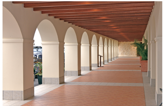
自然の光が差し込む回廊はリゾートホテルのような雰囲気。心地良い風が吹き抜けます。