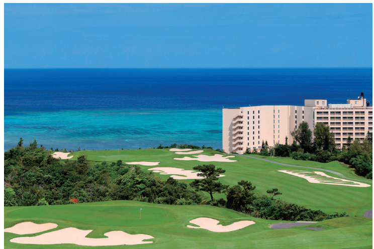
東シナ海を見下ろす絶景のロケーション。海を見渡す大パノラマでプレーができます。

県内有数のリゾートエリア・恩納村。東シナ海を見下ろす恵まれたロケーションにあるPGMゴルフリゾート沖縄は2017年4月、沖縄国際ゴルフ倶楽部から名称を改めるとともに、施設の全面改修も実施。よりお客さまに満足いただけるゴルフ場へと生まれ変わりました。約64万平米の広大な敷地にレイアウトされているのは、ブーゲンビリア、ハイビスカス、デイゴと、沖縄の植物を名前にした全3コース、27ホール。自然の起伏を巧みに生かした戦略性の高いコース設計は、青木功プロの改造監修によるもので、どのホールからも海を眺めながらプレーが楽しめます。