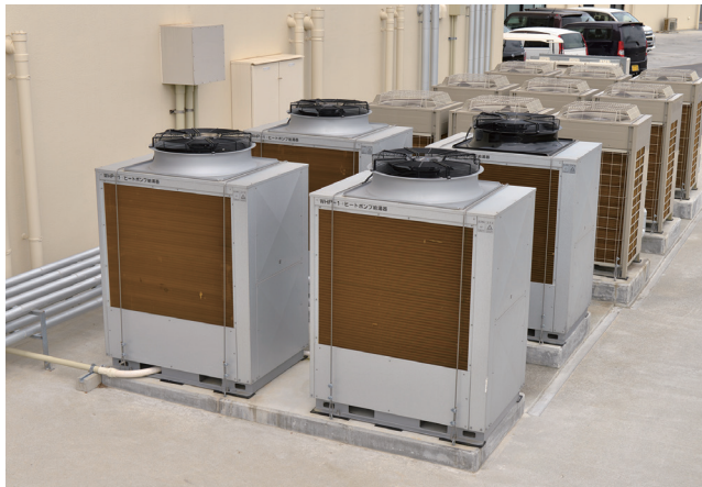
エコキュート（加熱能力30kW×4台）