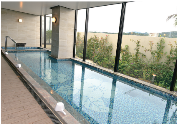
ハイビスカス模様のモザイクタイルが施された浴槽が南国らしさを演出。

※業務用蓄熱調整契約は平成29年3月31日をもって新規加入の受付を終了しております。詳細につきましては沖縄電力へお問い合わせください。