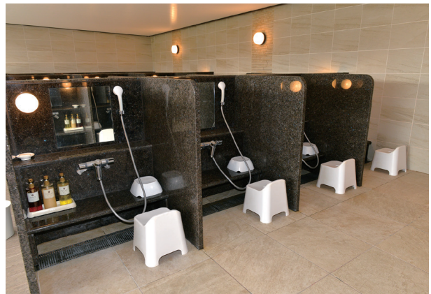
一人分のスペースにゆとりのある洗い場には仕切りも設置。